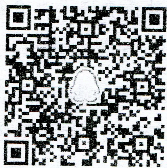
省级联络员 QQ 群