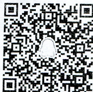
本科组项目团队 QQ 群