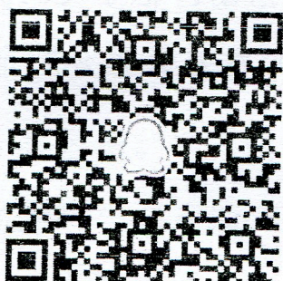
高职组项目团队 QQ 群